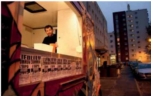
Soirée crêpes aux Mourinoux, Asnières.