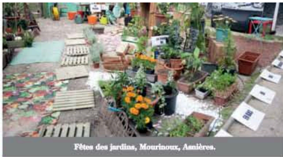
Fêtes des jardins, Mourinoux, Asnières.