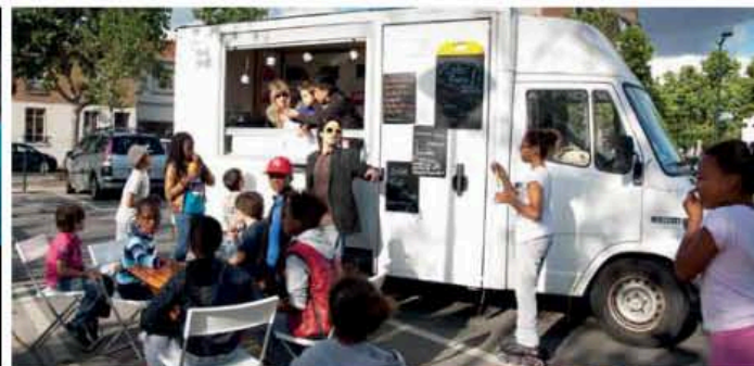
Fête de la musique, place de la République, Asnières. En attendant que la musique commence...