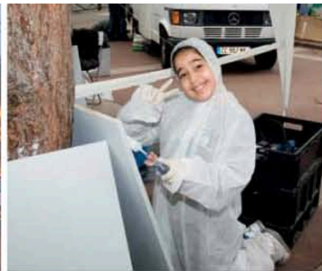
Atelier bricolage avec les enfants de la MLC, Asnières.