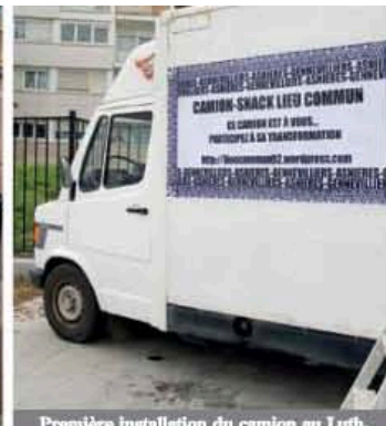
Première installation du camion au Luth, à Gennevilliers pour lancer l'atelier bricolage public.