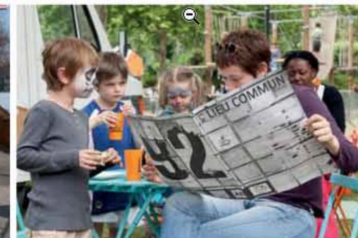
Fête d'Asnières, parc Robinson. Une maman découvre le journal du projet, écrit par les habitants des quartiers nord.